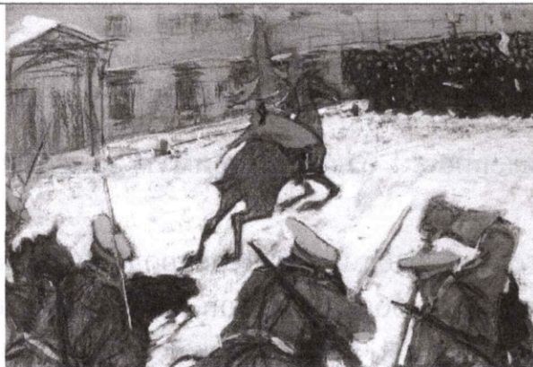
3. В.А. Серов «Солдатушки, бравы ребятушки! Где же ваша слава?»