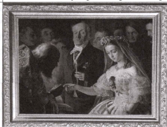
2. В.В. Пукирев «Неравный брак»