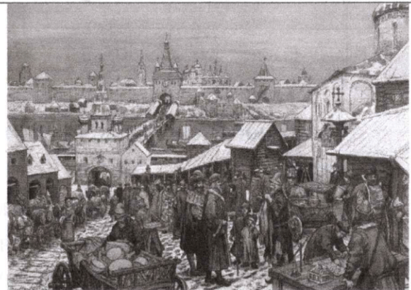
4. А.М. Васнецов «Новгородский торг»