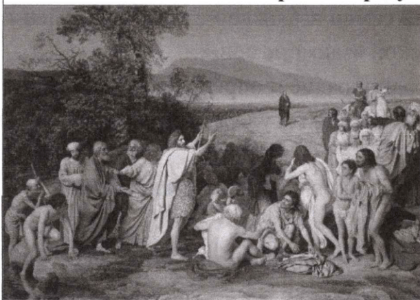
1. А.А. Иванов «Явление Христа народу»